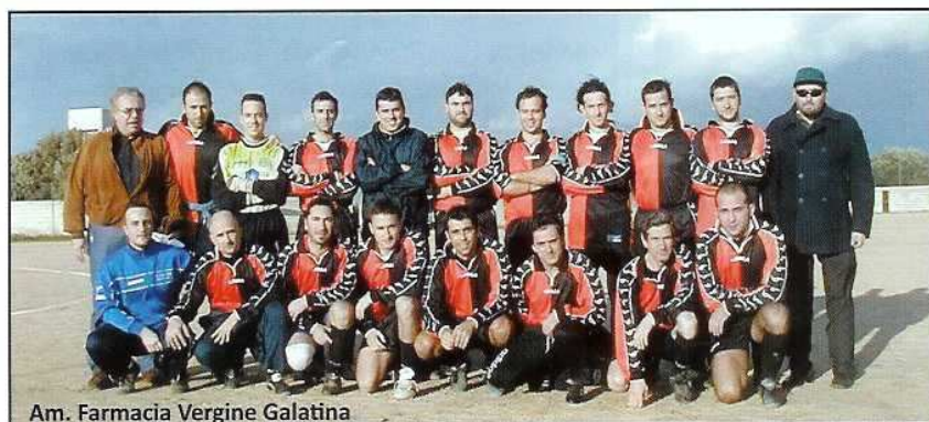
Am. Farmacia Vergine Galatina

Per i vostri messaggi, quesiti, foto, scrivete alla nostra redazione: mensilecolpoditacco@gmail.com Daremo spazio agli spunti più interessanti.